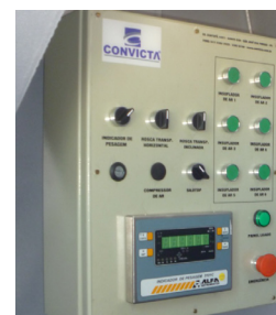
Painel de comando para operação do silo