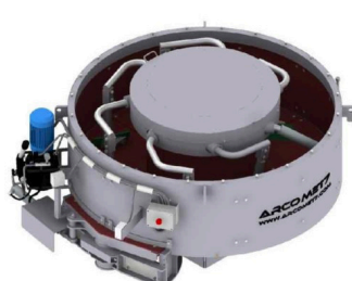
Misturador Planetário MVA 1500 (1 m 3 ) Arcomet