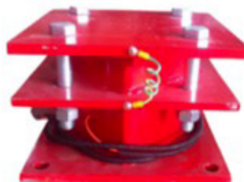
Sistema de pesagem