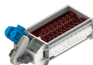
Misturador Contínuo para CCR de 300 a 600 toneladas/hora