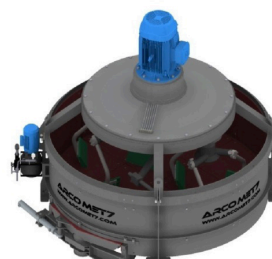
Misturador Planetário MST 1500 (1 m 3 ) Arcomet