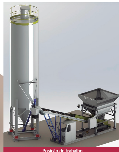
Posição de trabalho