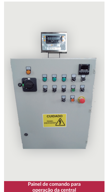
Painel de comando para operação da central