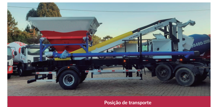
Posição de transporte