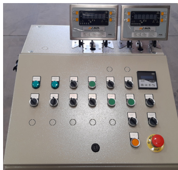
Mesa de comando tipo plano para operación de la planta