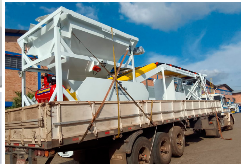
Posición de transporte