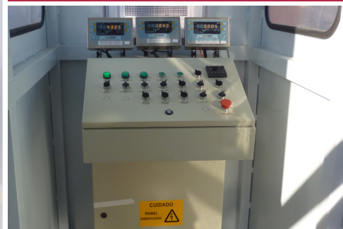
Cabina de operación con panel de comando de la planta tipo piano