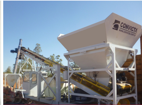
Posición de trabajo