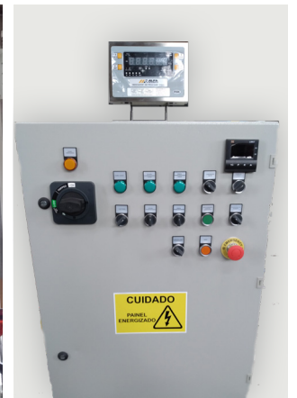
Panel de comando para operación de la planta