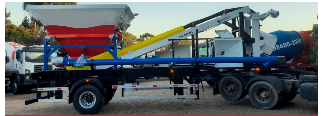
Posición de transporte