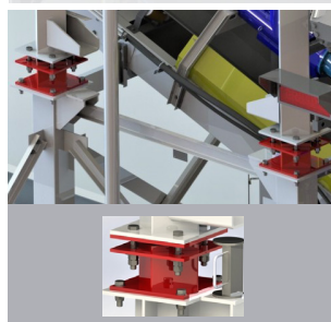
Sistema de pesagem com capacidade máxima de 120 ton