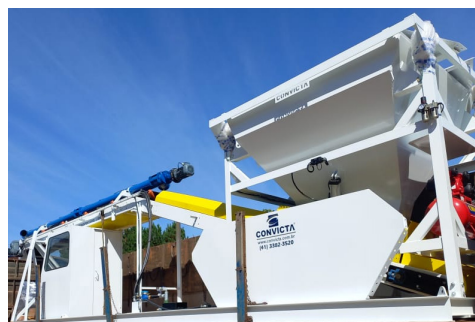
Posição de transporte