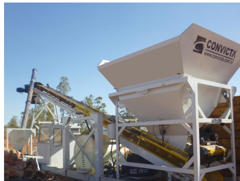
Posição de trabalho