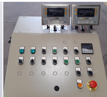
Mesa de comando tipo plano para operação da central